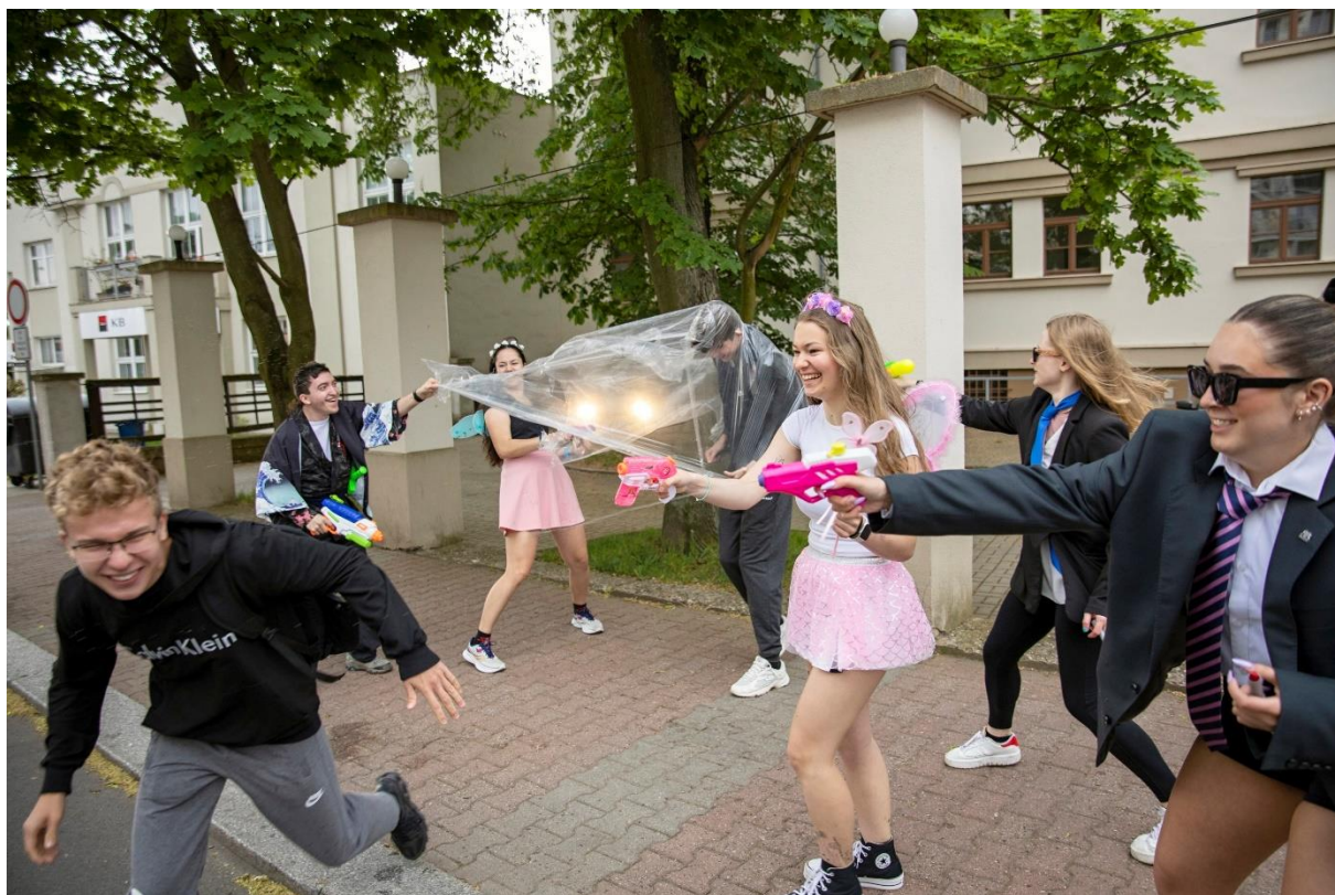
Poslední zvonění žáků oktávy a 4. A, 17. 5. 2024