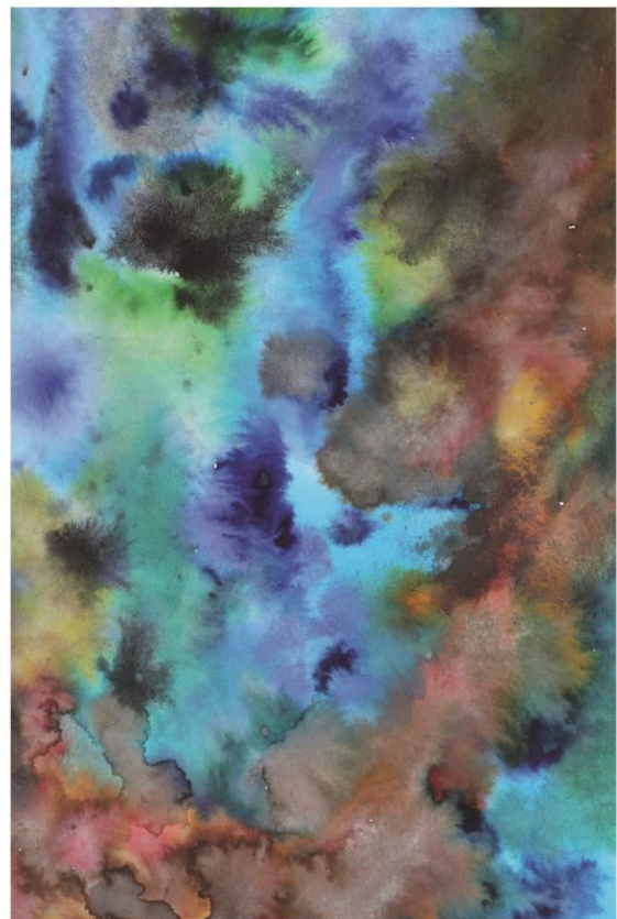
Výtvarné práce žáků gymnázia