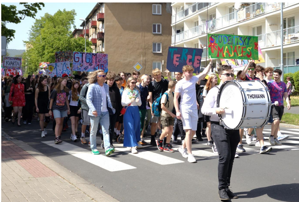
Majáles, 30. 4. 2024