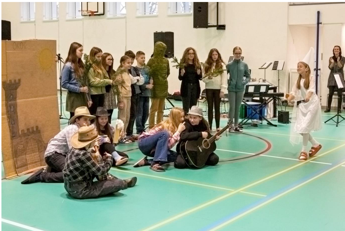
Vánoční besídka, 21. 12. 2023