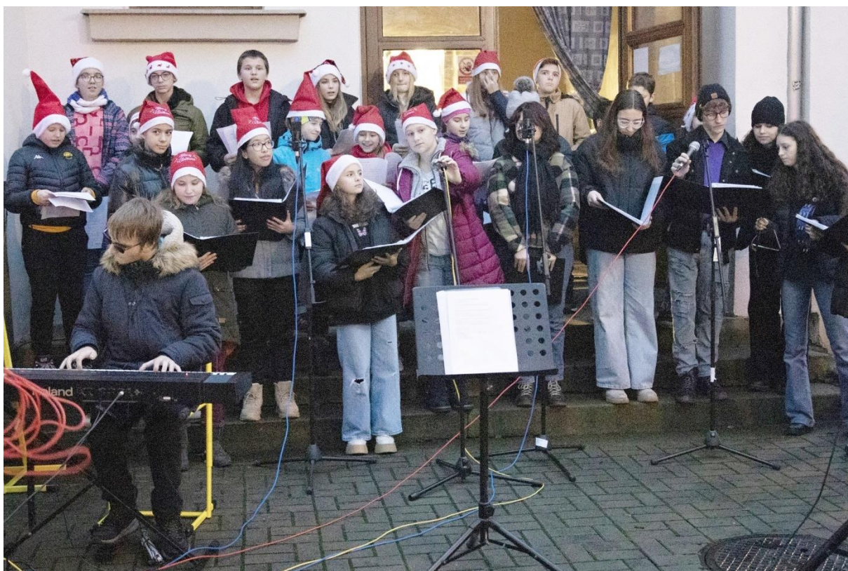
Zpívání na schodech, 13. 12. 2023