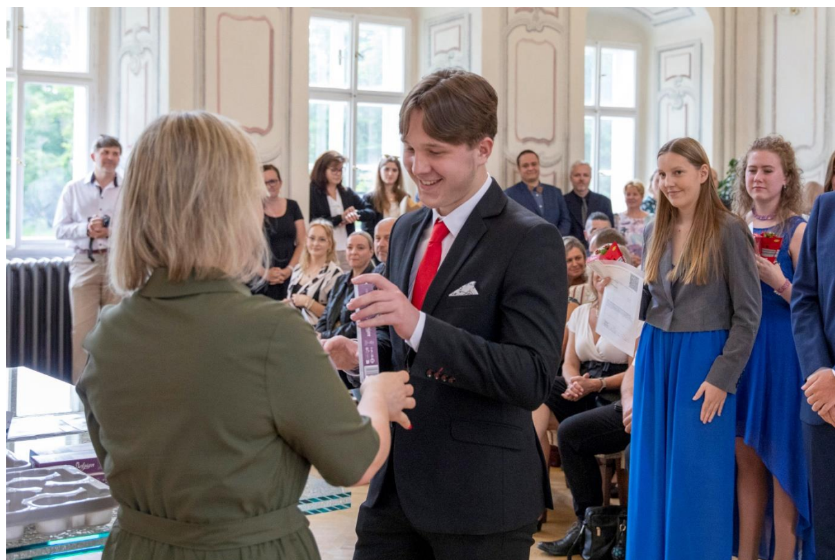
Slavnostní vyřazení maturantů, 31. 5. 2024, Zámek Valdštejnů