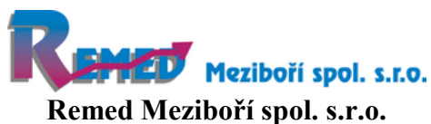
Remed Meziboří spol. s.r.o.