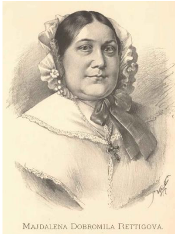
MAJDALENA DOBROMILA RETTIGOVÁ

Dobromila (jinak také Dobruška, Dobruše, Romy, Mila, Mily) je ženské jméno slovanského původu, které bylo vytvořeno překladem řeckého jména Agáta. Jméno vykládáme jako žena milující dobro nebo jednoduše dobrá, laskavá . Nejvýznamnější nositelkou jména je česká spisovatelka přelomu 18. a 19. století Magdalena Dobromila Rettigová (1785–1845), autorka knihy Domácí kuchařka (1826). Rettigová se vedle vaření věnovala výchově a výuce dívek, vedla svůj společenský salón ( kafíčková společnost ), osobně se stýkala s vlastenci (Palacký, Jungmann, Šafařík) a stála u všech významných kulturních akcí svého okolí, o nichž referovala coby dopisovatelka do časopisu Květy .