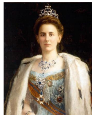
Královna Vilemína (1898)

Dvě zajímavosti na konec: Od roku 1981 navštěvovala královna se svou rodinou během svátku vždy dvě obce v jedné provincii – návštěva byla živě přenášena televizí a rozhlasem. Roku 1988 vyvolala královna Beatrix pozdvižení, když se po oficiálních oslavách objevila i se svou rodinou v Amsterdamu a slavila zde spolu s občany – ti si zpočátku mysleli, že se jedná o dvojnici.