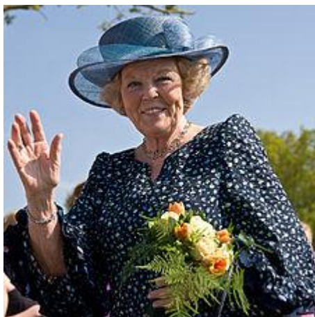
Beatrix Vilemína Armgarda Oranžsko-Nasavská, princezna oranžsko-nasavská, princezna z Lippe-Biesterfeldu (* 31. ledna 1938 v Baarnu), je bývalá královna Nizozemska (30.4.1980 až 30.4.2013, kdy abdikovala ve prospěch svého syna Viléma-Alexandra). Úmysl abdikovat oznámila již 28. ledna téhož roku. Od své abdikace má titul princezna Beatrix.

Nová královna Beatrix ve svém korunovačním projevu (30. dubna 1980) vyhlásila, že 30. duben se i nadále bude slavit jako národní svátek na počest její matky, královny Juliány, protože její vlastní narozeniny připadají na 31. leden, tedy období s vesměs špatným počasím.